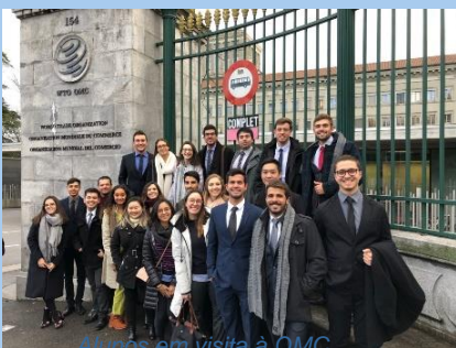
Alunos em visita à OMC

Strategic Innovation Management: Innovation Strategy, Reverse Innovation, Emerging Technologies; Co-creation and Intellectual Property Management; Public-Private partnerships.