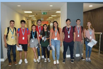
Turma Julho 2018